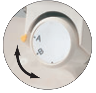
A: 1本針3本糸ロック B: 変形巻きロック

普通ロックと巻きロックの切换えは、ダイヤルをまわすだけ。巻きロックはジョーゼットやオーガンジなどの薄い生地のシルエットを引き立てるのに最適。