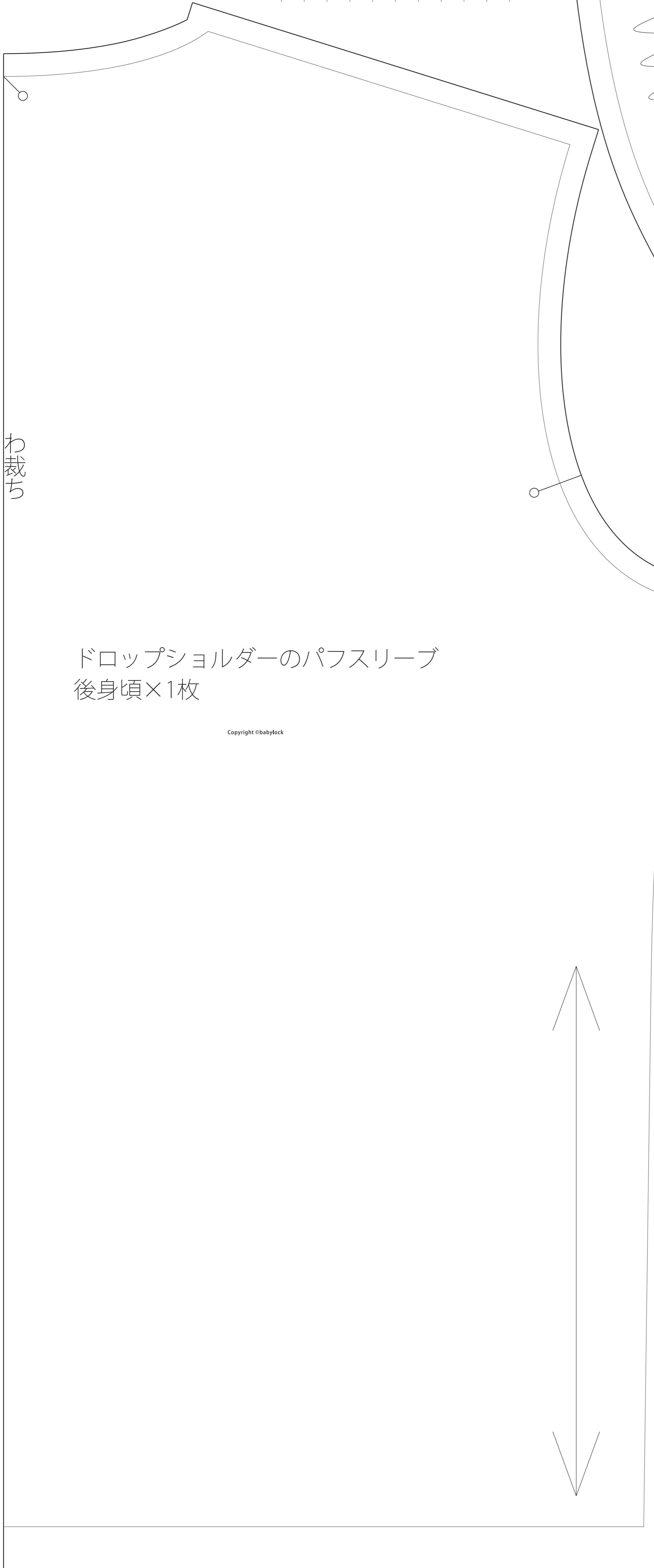
ドロップショルダーのパフスリーブ 後身頃×1枚